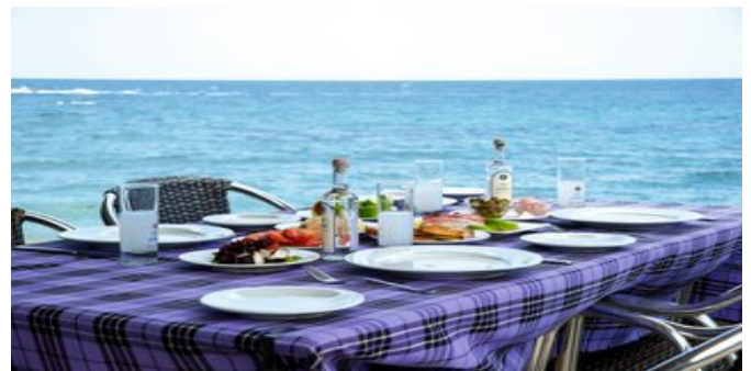
Blick auf das Meer