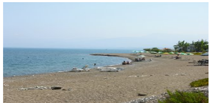
Der Strand beim Hotel