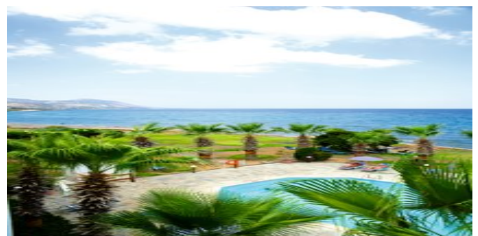
Gartenanlage mit Pool