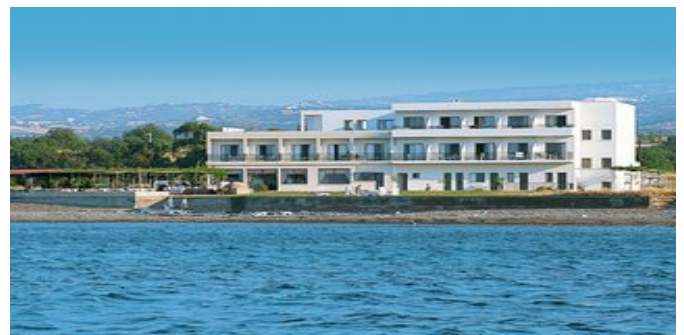
Das Hotel Souli