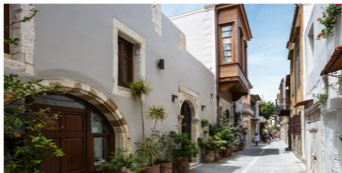
Casa dei Delfini

LAGE Zentral in der Altstadt von Réthymnon. Einkaufsmöglichkeiten, Tavernen und alle Sehenswürdigkeiten Réthymnons sind zu Fuß zu erreichen. Zum Stadtstrand sind es ca. 900 m, ein Busbahnhof mit Verbindungen nach Heráklion und Chaniá liegt ca. 500 m vom Hotel entfernt.