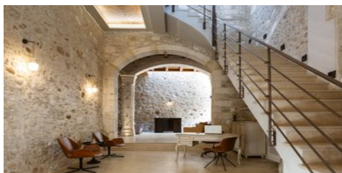
Casa dei Delfini