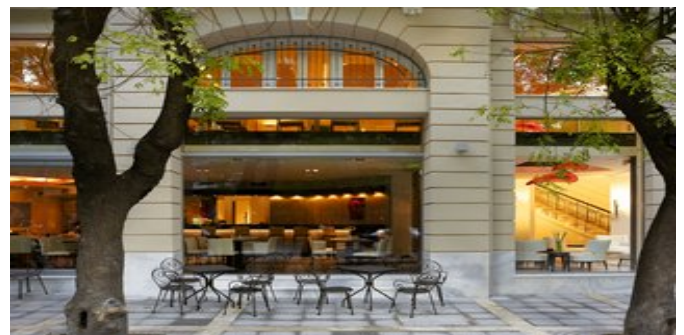
Das Hotel The Excelsior