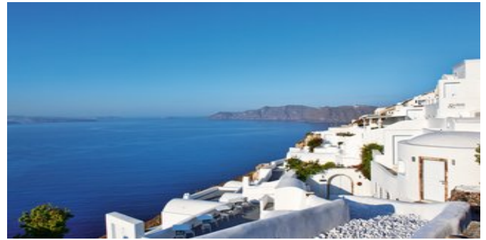
Das Canaves Oia Hotel