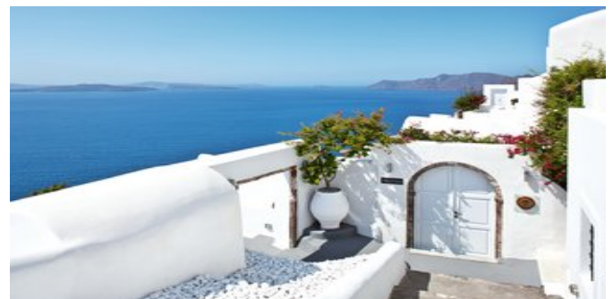
Das Canaves Oía Hotel