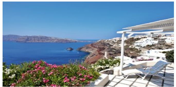
Blick auf das Meer