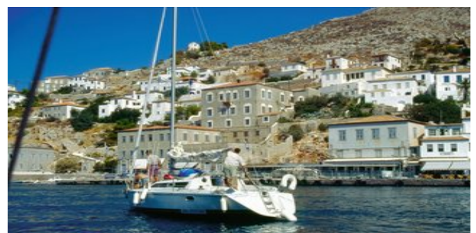
Blick auf Hydra-Stadt