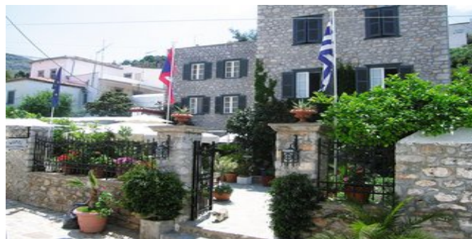
Das Hotel Mistral