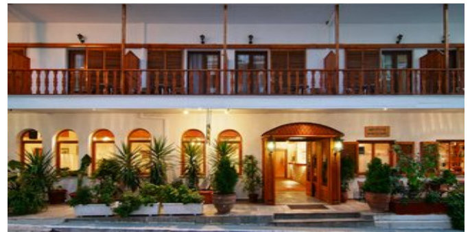
Blick auf das Hotel