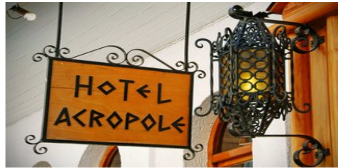
Das Hotel Acropole Delphi