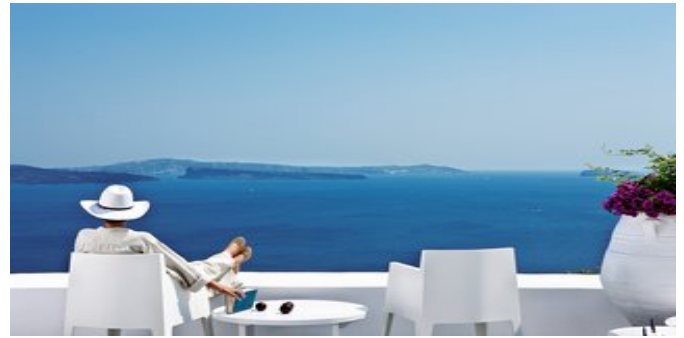
Zeit zum Geniessen