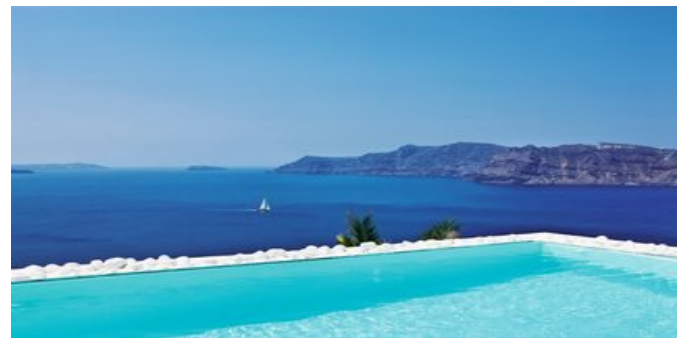
Blick vom Poolbereich