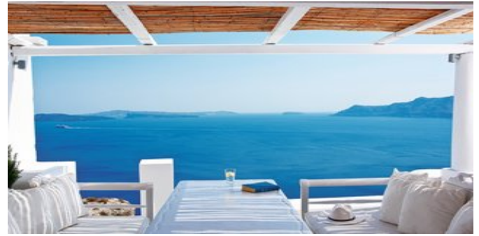
Auf der Terrasse