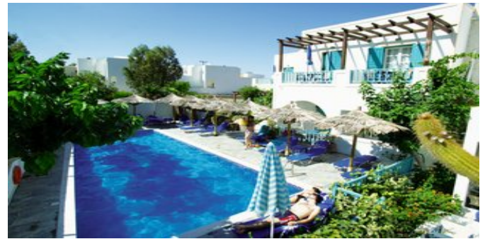
Das Hotel Andreas mit Pool

SPARTIPP Bei Buchung eines Attika Mietwagens ab/bis Flughafen Transfergutschrift EUR 38 pro Person. Einen Mietwagen der Kat. A1 erhalten Sie schon ab EUR 140 pro Woche.