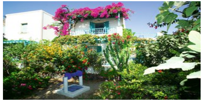
In der Anlage