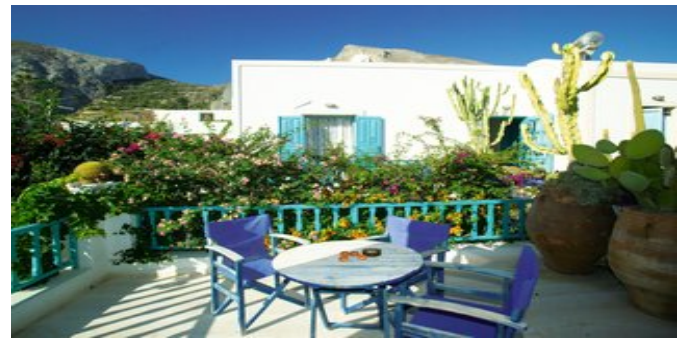
Auf dem Balkon