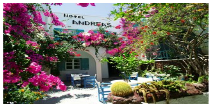
Das Hotel Andreas