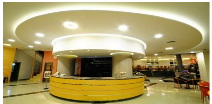
An der Rezeption