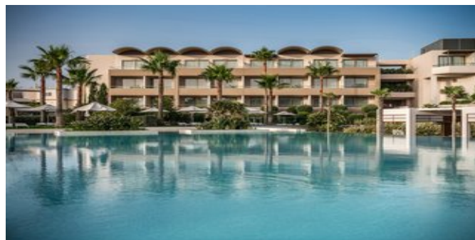
Einer der Pools

VERPFLEGUNG HP, AI (reichhaltiges Frühstücksbuffet und Abendessen als Buffet im "Basilico" Restaurant oder im "Xatheri" Restaurant. Im Rahmen des Dine Around Programms können Halbpensions-Gäste auch in den drei À-la-carte-Restaurants ihr Mittag- oder Abendessen einnehmen, wobei der Betrag von 12