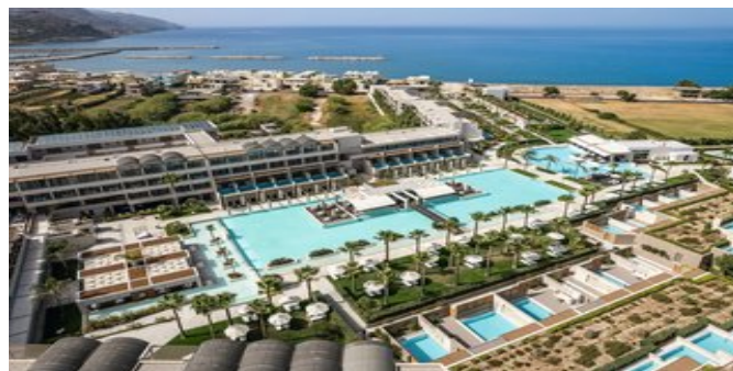
Das Avra Imperial

DELUXE ZIMMER MIT GEMEINSAMEM POOL (RC) Ca. 32 qm. Grundausstattung wie die Deluxezimmer. Bad/WC mit Wanne und Dusche (Hydrojet-Massage), Föhn, Bademantel, Slipper, luxuriöse Pflegeprodukte, Pooltücher. Terrasse mit Liegen, direktem Zugang zum gemeinsamen Süßwasserpool und Blick auf den Garten oder den Pool.