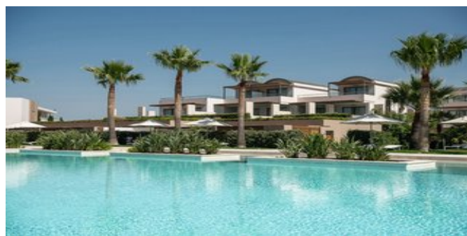
Einer der Pools