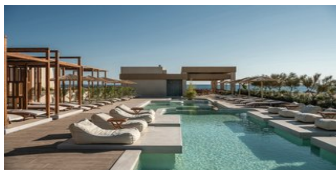
Avra Seaside Poolbereich