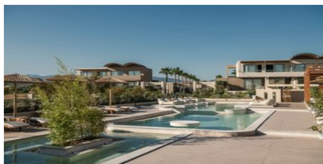
Einer der Pools