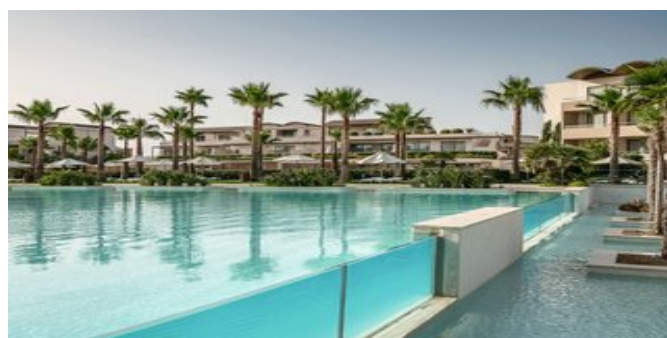
Einer der Pools