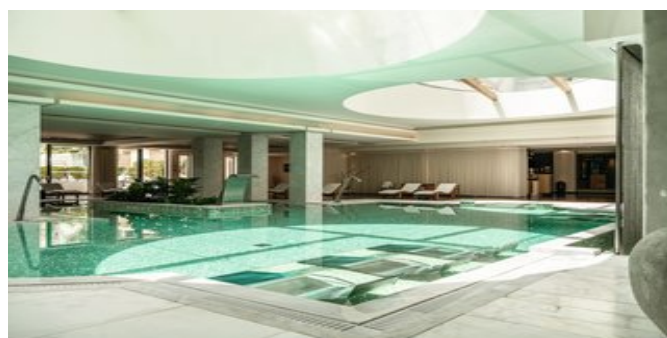
Der Spa Indoor Pool