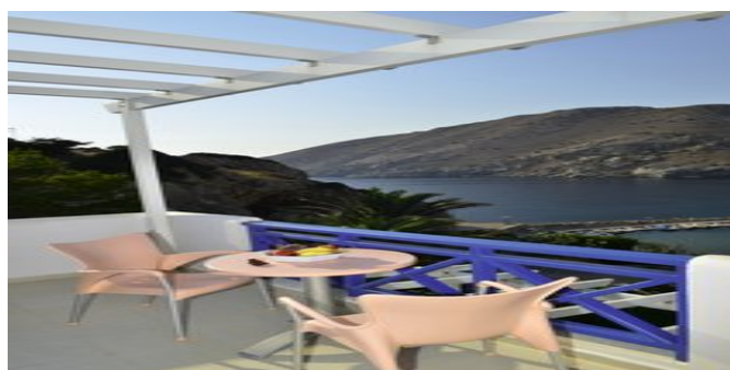
Blick auf das Meer