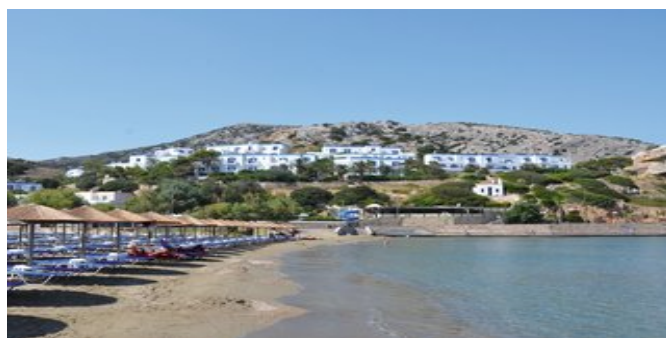
Das Hotel Dolphin Bay